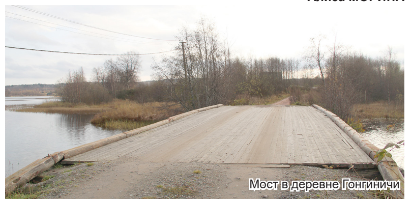
Мост в деревне Гонгиничи