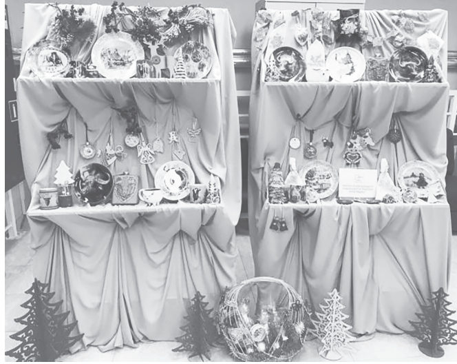
Образцы продукции особенных ремесленников