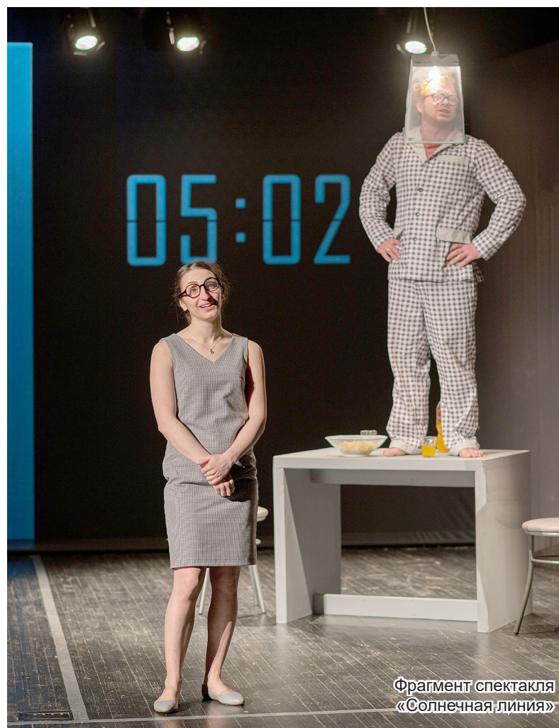
Фрагмент спектакля «Солнечная линия»