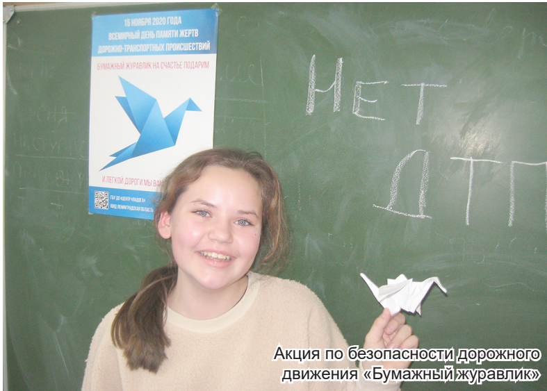
Акция по безопасности дорожного движения «Бумажный журавлик»

По статистике ГИБДД только за один III квартал 2020 года на территории Российской Федерации с участием детей в возрасте до 18 лет произошло 7 814 дорожно-транспортных происшествий, в которых погибло 287 человек, а получили ранения 8 681 человек. За тот же период в Ленинградской области было зарегистрировано 147 дорожно-транспортных происшествий, в которых погибло шесть детей, а ранено – 172 ребёнка. Это поистине страшные цифры, связанные с несоблюдением правил дорожного движения, как водителями, так и пешеходами. Согласно резолюции Генеральной Ассамблеи Организации Объединённых Наций каждое третье воскресенье ноября объявлено Всемирным днём памяти жертв дорожно-транспортных происшествий. Тем самым мировое сообщество постаралось привлечь внимание всех жителей планеты Земли к факту того, что ежедневно в мире в результате дорожно-транспортных происшествий гибнет более трёх тысяч человек, причём большую часть погибших и пострадавших составляют дети и молодёжь. В этом году эта скорбная дата приходится на 15 ноября.